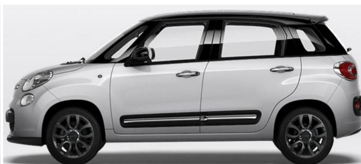
6Y3 Vopsea bicoloră pastel Grigio Maestro/ Nero