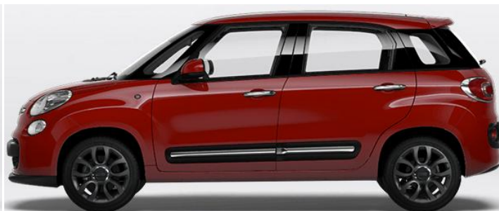
5CG Vopsea pastel Rosso Passion