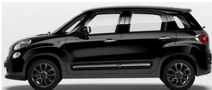
5DL Vopsea pastel Nero Cinema