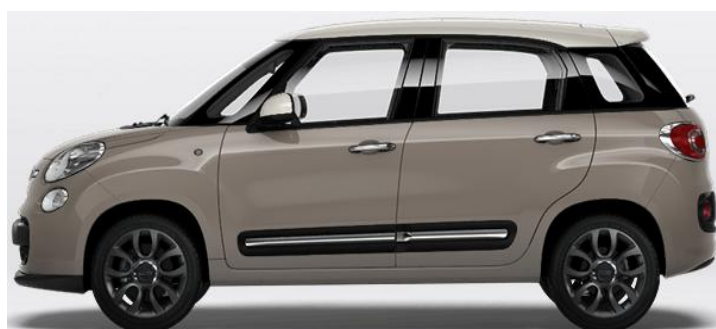
4DL Vopsea bicoloră Capuccino Beige/ Bianco