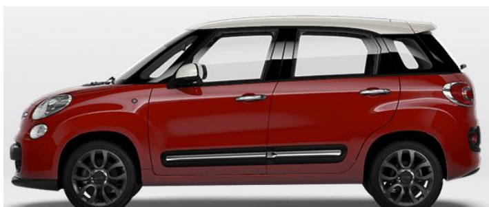
6Y0 Vopsea bicoloră pastel Rosso Passion/ Bianco