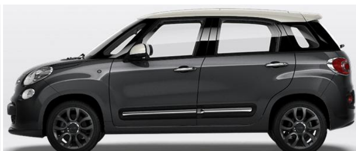
6Y1 Vopsea bicoloră pastel Grigio Moda/ Bianco