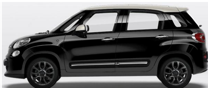
5EZ Vopsea bicoloră pastel Nero/Bianco