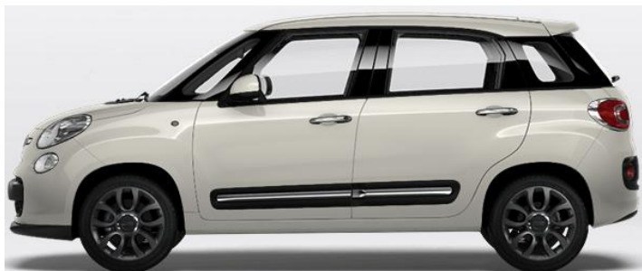
5CF Vopsea pastel Bianco Gelato