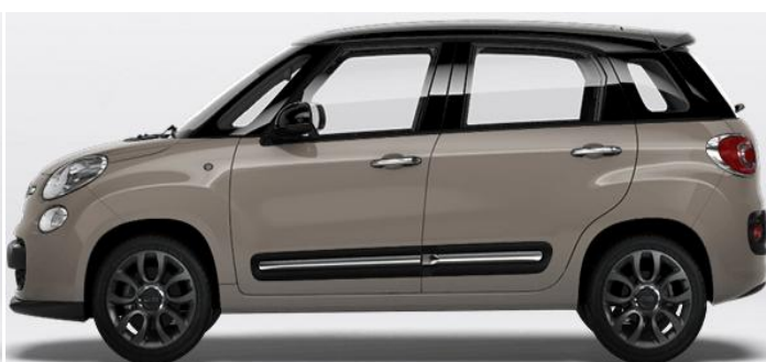
4DT Vopsea bicoloră Capuccino Beige/ Nero