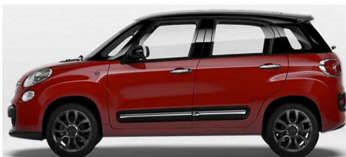
6Y2 Vopsea bicoloră pastel Rosso Passion/ Nero